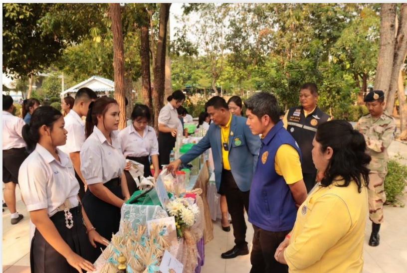
การจัดแสดงผลงานในรูปแบบตลาดนัดโรงเรียน ในงานคลินิกเกษตรเคลื่อนที่ ในพระราชานุเคราะห์ สมเด็จพระบรมโอรสาธิราชฯ